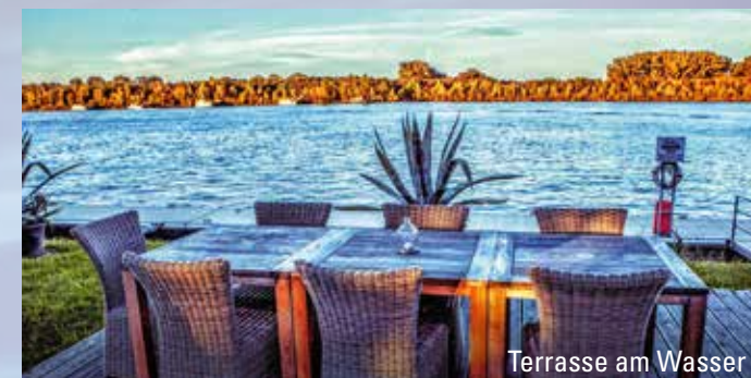
Terrasse am Wasser