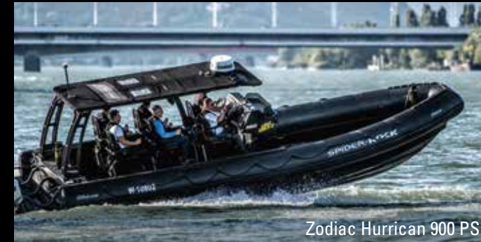
Zodiac Hurrican 900 PS