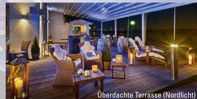
Überdachte Terrasse (Nordlicht)